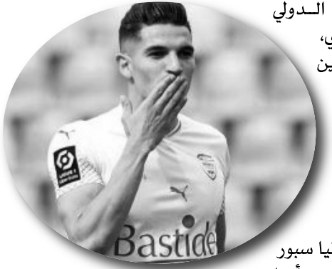
توصل الدولي الجزائري زين الدين فرحات، إلى اتفاق رسمي مع مسؤولي نادى ألمانيا سبور