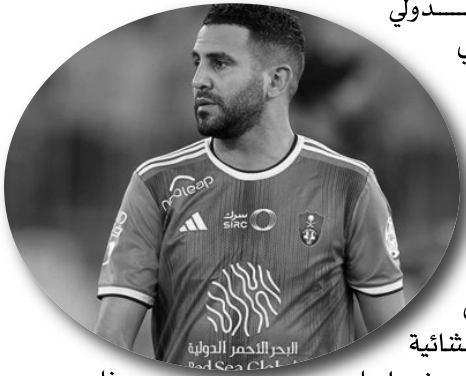
قائد السدوي الجزائري رياض محرز فريقه الأهلي