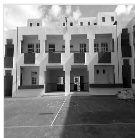
متوسطات قديمة إضافة إلى ملحق لتانوية بمنطقة بن سعدون الواقعة على بعد 15 كلم عن بلدية الفايحة.

وفي ما يخص الطور الثانوي فسيتمتع من جهته بسبعة هياكل منها منشآتان جديدتان وخمس أخرى ناتجة عن تحويل مدارس أو