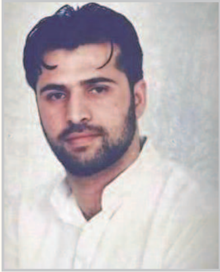
الإعلامي والإجهايري على الساحة الفلسطينية.

قاعدة أساسية وهي دلالات هذا الفعل على الساحة الاعتقالية والساحة الوطنية بشكل عام، فهي بكل المقاييس تجربة يحتذى بها، ويجب أن تشكل رافعة حقيقية للفعل النضالي الفلسطيني على كافة الأصعدة سياسياً وإعلامياً وجماهيرياً وحتى لأفعال المقاومة العسكرية والشعبية، وهذا بالذات ما يدفعنا من هذا الموقع المتقدم لدعوة كافة فصائل العمل الوطني للاقتداء بتجربة الأسرى وتطوير أدوات جديدة يمكن أن تكون منطلقاً وقاعدة متينة تنطلق منها لإعادة الاعتبار فعلياً للوحدة الوطنية وطى صفحة الانقسام الذي شكل حالة من الشلل المتواصل لكافة مفاصل العملية النضالية، ما أدى لما نراه اليوم من حالة تغول غير مسبوق على كافة مكتسيات الشعب الفلسطيني، بما في ذلك المحاولات الجديدة من قبل حكومة المستوطنين الفاشية لحسم الصراع وتحويل حلم الشعب الفلسطيني بالتحرك إلى غاية يستحيل تحقيقها. لقد شكلت لجنة الطوارئ العليا للحركة الوطنية الأسيرة صمام أمان حقيقي للحركة الأسيرة، وهي قادرة على التعاطي مع أشكال الاستهداف القادمة إذا ما استطاعت المحافظة على تماسكها ووسعت قاعدة فعلها وعززت من حضورها