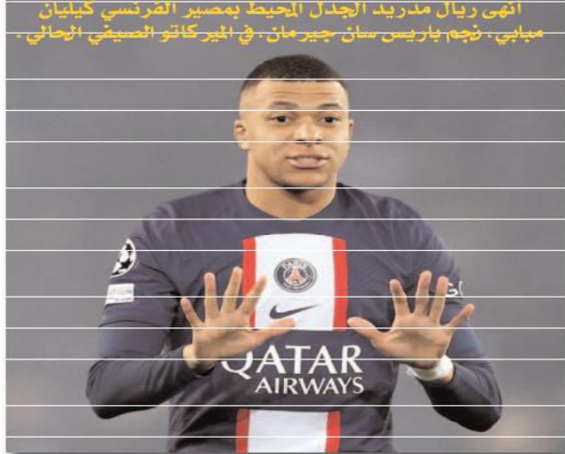
أنهى ريال مدريد الجدل المحيط بمصير الفرنسي كيليان مبابي، نجم باريس سان جيرمان، في الميركاتو الصيفي الختامي.

قال أولي هونيس الرئيس التنفيذي لبايرن ميونخ، إن البافاري بحاجة إلى إصلاحها، بعدما سار في الطريق الخاطئ، وسيقضي لهونيس، تولي منصب المدير الإداري لبايرن ميونخ ورئيس النادي خلال مسيرة مهنية طويلة استمرت لثلاثة عقود. ويتواجد هونيس ضمن المجلس الإداري بالنادي، وكذلك ضمن اللجنة الرياضية التي تشرف على الانتقالات واقتناء اللاعبين. وأضاف هونيس في تصريحات لصحيفة بيلد أنه سونناج "بايرن ميونخ كان يسير في الاتجاه الخاطئ منذ فترة". وتابع "النادي افتقد الهياكل شيئا ما مؤخرا حيث كان هناك العديد من المستشارين الخارجيين، وعلينا أن نعود للسلار الصحيح، بايرن يجب أن يشهد استخفاضا بداخله يحددون هوية النادي بأنفسهم". وكان اختيار هونيس وزميله لفترة طويلة كلر هاينز رومينغه رئيس التنفيذ السابق، قد وقع على اللاعبين السابقين أوليفر كان وحسن صالح حينئذ تولي منصب الرئيس التنفيذي وعضو مجلس الإدارة لشؤون الرياضة، لكن بايرن ميونخ أعلن الاستغناء عن خدمات أوليفر كان حينئذ في ماي الماضي لأسباب من بينها ظروف إقالة ناغلسمان من منصب المدير الفني للفريق في مارس-توتولي بان كريستيان دريسن، منصب الرئيس التنفيذي، كما سيتولى كريستوف فروند منصب مدير الكرة اعتبارا من سبتمبر المقبل. وقال هونيس إنه رومينغه كان قد عمل معا بشكل جيد من جديد، بعد خلاف سابق حول قضايا مختلفة.