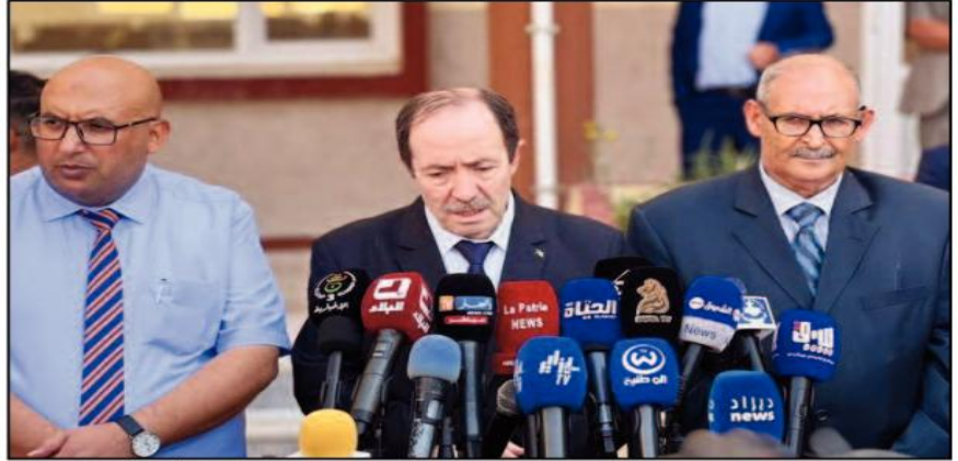
فلة . س

ولفت وزير التربية الوطنية في الندوة الصحفية إلى تنصيب السنة الثالثة ثانوي شعبة الفنون ابتداء من هذا الدخول المدرسي ما يسمح برفع عدد شعب امتحان البكالوريا في جوان القادم من 6 إلى 7 شعب بعد تنصيب السنة الثالثة فنون.