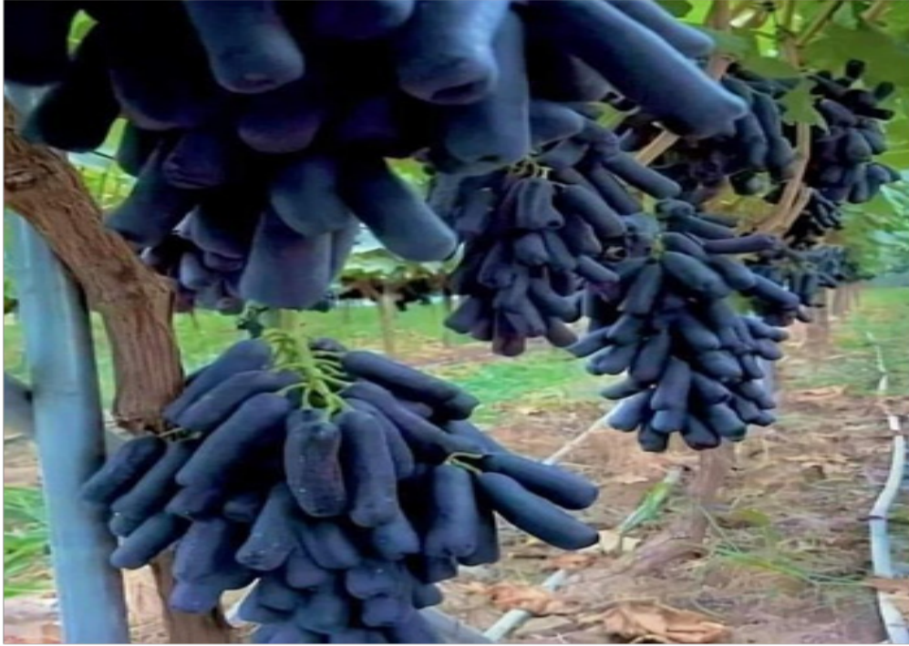
محصول العنب لأحد الفلاحين في ولاية بومرداس