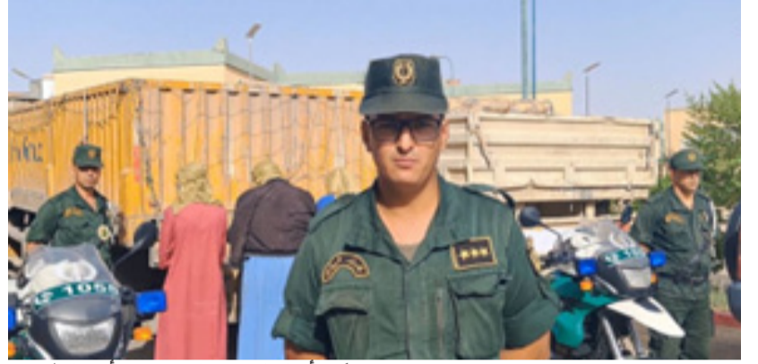
تمكن أفراد السرية الإقليمية لأمن الطرقات للدرك الوطني بالوادي من توقيف ثلاثة

السرية الإقليمية لأمن الطرقات للدرك الوطني بالوادي فتحت تحقيق في القضية، فور الانتهاء من التحقيق سيتم تقديم المشتبه فيهم أمام السيد وكيل الجمهورية المختص إقليميا.