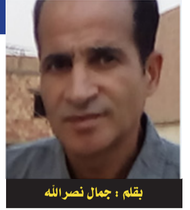
يقلم: جمال نصرالله

وظفها في الحصول على مشاريع في التهيئة العمرانية وكذا الإطعام المدرسي والمقاولة التي يملك عائداتها يوم كان عضواً بلدياً، واليوم صنع قائمة من أجل الفوز بالترناسة طمعاً في الحصول على مشاريع أكبر، والغريب أن كل هذه السجلات التجارية بأسماء لأقارب منه وإليه! أي أن جلها يصب في جيب واحد. والأكيد بأنها ليست الحالة الاستثناء في هذا الوطن وإنما مجرد عينة ليس إلا. صاحبنا الذي تحدثنا عنه في البدء هو إسلامي سني محض، وهذا ليس عيباً بل فخراً ومجداً قلما يتحقق في هذا العصر وصعوبات الحياة وتناقضاتها، والثاني المرشح هو ليبرالي أكثر ما عرف عنه هو انخراطه في الفساد ولا إيمان لديه إلا المال ولغة البنزين. أم المشكلات هنا هي أن الليبرالي كان يصدق على الإسلامي ويده بالمال بما يكفي إلى درجة أنه استقبل بسكن خاص واشترى سيارة فاخرة. والأغرب من ذلك أنه كان يسمع بتلاعيات أخيه لكنه يغض الطرف بل يمسك الأموال ولاذن سمعت أو عين رأته. وقد صدق من قال بأن المال