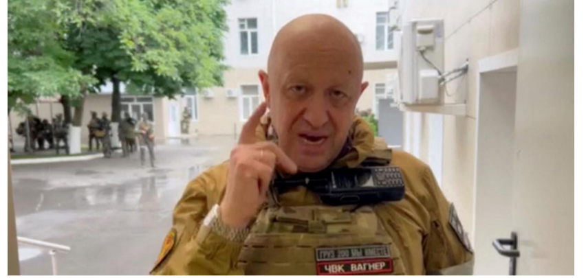
قراءة / محمد علي

أدى مقطع مدته 40 ثانية من مقابلة قديمة قال فيها رئيس مجموعة فاجنر العسكرية الروسية الخاصة يفجيني بريجوجن إنه يفضل أن يُقتل على أن يكذب على بلاده، وتحدث عن طائرة تنفك في السماء، إلى إطلاق العنان لموجة من الافتراضات على الإنترنت يوم الأحد بشأن وفاته المفترضة.