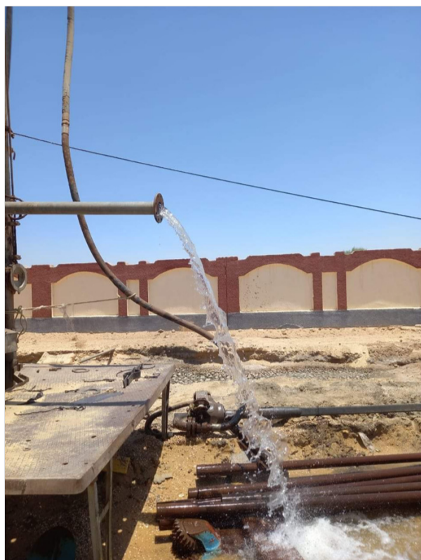
من أجل القضاء على المشاكل رغم توفرها على بئر ألياني العالقة في كل أحياء المدينة كبد خزينة الدولة الملايير.

يشتكى سكان بلدية الحجيرة من نقص المياه وتذبذبها في كافة الأحياء عبر كامل الدائرة، وهذا راجع الي قلة التدفق من القناة الرئيسية من البئر الألياني المتواجد بالدائرة الذي كلف خزينة الدولة الملايير.