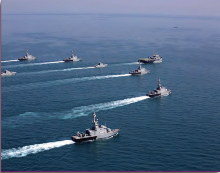
"الحد من قوة إيران"