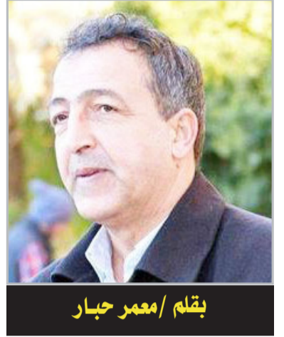
بقلم /معمّر حبار

تأملت الأيام الأخيرة لسيدنا رسول الله صلى الله عليه وسلم فوقفت عند النقاط التالية، راجيا السداد والتوفيق، وهي: