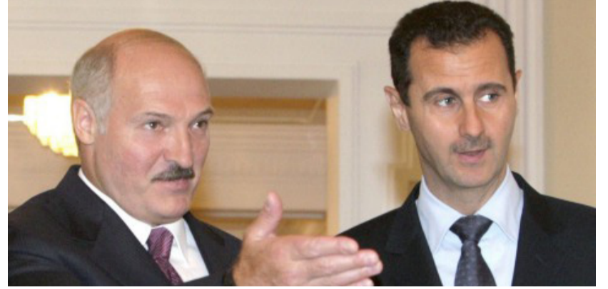
قراءة / محمد علي

أكد رئيس بيلاروس ألكسندر لوكاشينكو مواصلة دعم بلاده للشعب السوري بمرحلة إعادة الإعمار، وذلك في برقية تهنئة نظيره السوري بمناسبة الذكرى الـ30 للعلاقات الدبلوماسية بين البلدين.