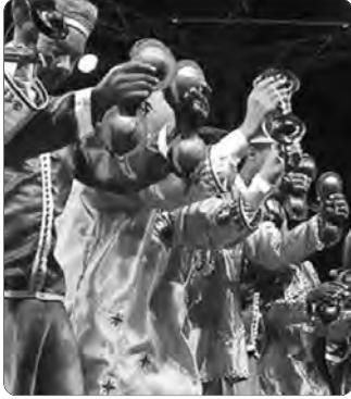
تتظم الطبعة العاشرة من أيام الفن القناوي ابتداء من اليوم، بدار الثقافة "أبي رأس الناصري" بمسكرو، تحت شعار "الديوان... فن جزائري أصيل"، حسب ما عُلم من المنظمين.