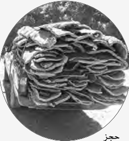
حجز أعوان الغابات

بعدم من المؤسسة الجهوية للهندسة الريفية، نهاية الأسبوع الماضي، كمية معتبرة من الضلّين المستقل بطريقة غير شرعية، وذلك بمنطقة واد "المبالة" وغابات "قياطين" بإقليم بلدية بني زيد غرب عاصمة الولاية، علما أن العملية تدخل في إطار مهام الشرطة الحراجية؛ من أجل حماية الثروة الغابية من كل أشكال الاعتداءات.