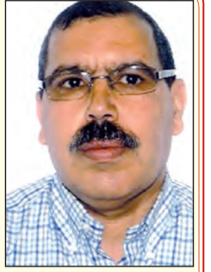
بقلم: لحسن بولسان

لم يكذب يصرح في شهر جانفي الماضي وزير الشؤون الخارجية والتعاون الإسباني، السيد خوسيه مانويل الباريس عن الاتفاق الأميركي الإسباني ل «توحيد الجهود» لحل النزاع في الصحراء الغربية،