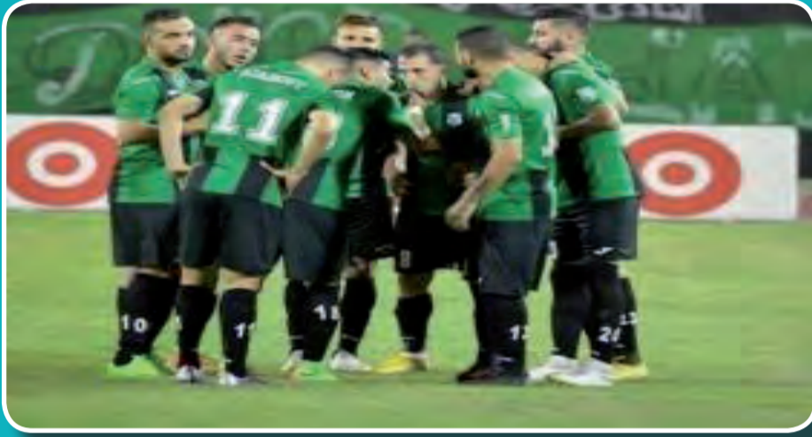
في منافسة رابطة أبطال إفريقيا، فريق شباب بلوزداد الثاني المتاهل من نادي بوجارس السيرا ليوني وليسر المعفي من الدور التمهيدي الأول، سيواجه في الدور الليبي.