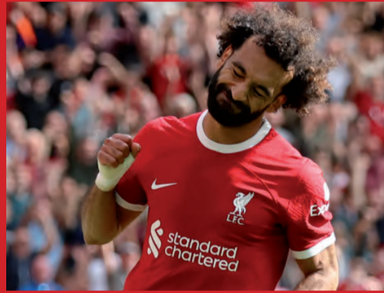
اختيار لوكاكو مع استهداف النادي واللاعب طريق الرحيل. وفي الجانب كتيب: "الريدز سيقاتل من أجل صلاح". ومن جانبها كتيب صحيفة "ديلي ميل": "باكيتا يواجه تحدياً في البرازيل بشأن المراهقات".

اهتمت الصحف الإنجليزية الصادرة صباح أمس الجمعة، بالعرض السعودي لمحمد صلاح نجم ليفربول، ومحاولة الريدز الإبقاء على النجم المصري. ويحاول اتحاد جدة بشتى الطرق، الحصول على جهود محمد صلاح، خلال الميركاتو الصيفي الحالي ووقع محمد صلاح، على عقد جديد مع ليفربول في الصيف الماضي، لينتهي في صيف 2025. وكتبت صحيفة "ديلي تلغراف" في الأعلى: "ليفربول يحذر السعوديين.. صلاح ليس للبيع". صحيفة "ديلي ستار": "ليفربول سيغير اتجاه أي عروض سعودية لمو". وفي الأسفل كتيب: "لوكاكو الذي لا يمكن اختياره"، في إشارة إلى أمر إدارة تشيلسي لماوريسيو بوكيتينو مدرب الفريق، بعدم اختيار المهاجم البلجيكي. وفي الجانب كتيب: "السيتي يضع حدا لتونيس"، في إشارة لرفض وولفرهامبتون 47 مليون إسترليني، مع رفض السيتي دفع 60 مليون إسترليني، وهو الرقم الذي يريده الذئب. ويدورها عنونت صحيفة "التايمز": "السعوديون يستهدفون صلاح.. الدوري المنافس يستعد لبعده اللاعب الأعلى أجراً في العالم". كما كتبت صحيفة "ميرور": "بوكيتينو تحت أوامر بعدم