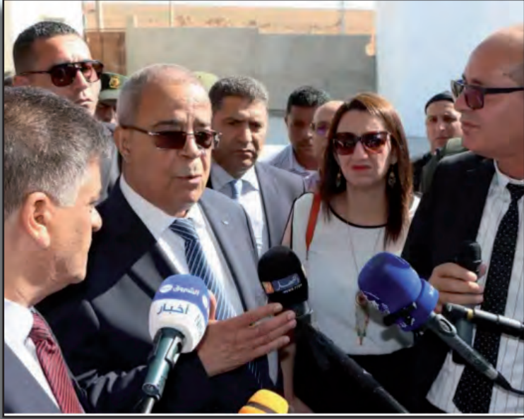
فرجيوة و شلغوم العيد و ميلة لتفقد «سوناريك» لإنتاج أجهزة التدفئة المنزلية و مجمع الصناعات الغذائية أغروديف.