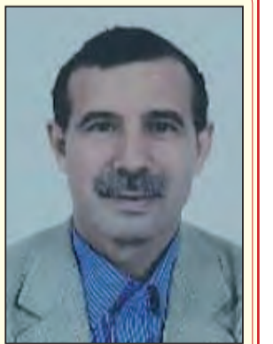
بقلم: محمد الأمين

أصيب نظام المخزن بهلع وخيبات أمل متتالية جراء الهزيمة المبكرة التي تلقاه في قمة البريكس