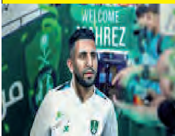
كما أن الجزائري كان وراء أهم الفرص في هذا الشوط، الذي كان خلاله الأهلي مسيطرًا بشكل كامل. ويريز محرز بتغيير مركزه في نهاية المباراة، حيث عاد في عدة مناسبات إلى الدفاع من أجل مساعدة بقية اللاعبين، وحاول أن يقدم الدعم في العمل الدفاعي في دليل جديد على حرصه على تقديم الإضافة، قبل أن يلعب دوراً حاسماً في تسجيل فريقه هدف الانتصار، حيث كان في بداية الهجوم الذي كان وراء الهدف الوحيد.

كان رياض محرز النجم الوحيد في صفوف الأهلي السعودي الذي ظهر بمستواه العادي، خلال المواجهة التي جمعت فريقه بالأخدود، الخميس، في الأسبوع الثالث من الدوري السعودي لكرة القدم، وحسمه رفاق النجم الجزائري بهدف مقابل لا شيء. وحاول المحارب استغلال قوته على يمين هجوم الأهلي من أجل الوصول سريعاً إلى مرمر المنافس الذي اختار التكتل الدفاعي، لكن كراته لم تجد لاعبا يستغلها بالشكل المطلوب أمام حسن انتشار مدافعي فريق الأخدود طوال المواجهة. وظهر النجم الجزائري قبل ضربة بداية الشوط الثاني وهو يتجاوز مع مدربه الألماني ماتياس ياسيله، حيث كان واضحاً أن محرز كان بصدد تقديم ملاحظاته حول أسباب الصعوبات الهجومية التي وجدها فريقه خلال الشوط الأول الذي غابت عنه الفرص الخطيرة.