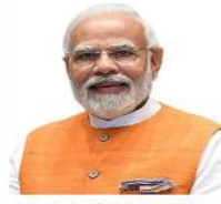
رئيس الوزراء الهندي ناريندرا مودي

أكد الرئيس بوتين في كلمته في الجلسة العامة لقمة «بريكس» المنعقدة في جوهانسبرغ بجنوب إفريقيا أن الغرب يسعى للهيمنة،