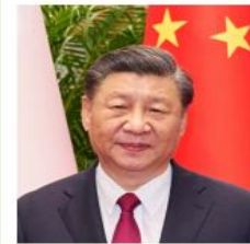
الرئيس الصيني شي جين بينغ

لدول «بريكس». وشدد على أهمية تعزيز التعاون السياسي والأمني لتحقيق الاستقرار. كما أشار إلى تأثير نمط الحرب الباردة ودعا إلى التطور السلمي لدول «بريكس». وأكد على القوائد والمخاطر المرتبطة بالذكاء الاصطناعي. هذا وقدم الرئيس الصيني مقترحا لتطوير التعاون في مجال التعليم والتعليم الرقمي. وأكد على أهمية العدالة