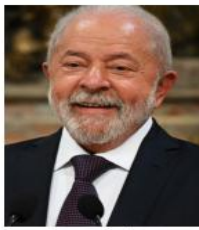
الرئيس البرازيلي لويس إيناسيو لولا دا سيلفا

مودي، رئيس الهند، ألقى كلمة ملهمة في المنتدى الدولي، حيث أعرب عن تطلعاته لتعزيز التعاون وتطوير العلاقات داخل مجموعة «بريكس». أكد على أهمية تعزيز الاتصالات بين