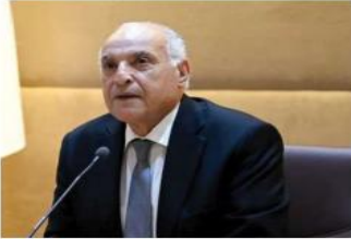
يترأس في النيجروسيل الأمانة في النيجروسيل بجناب هذا البلد والمنطقة بأسرها تداعيات التصعيد العنتم للأوضاع.

بتكليف من رئيس الجمهورية السيد عبد المجيد تبون شرع وزير الشؤون الخارجية والجنسية الوطنية بالخارج السيد أحمد عطايف ابتداء من أمس إلى كل من نيجيريا والبنين وغانا. والإجراء مشاورات مع نظرائه في هذه البلدان التي تنتمي إلى المجموعة الاقتصادية لسول غرب إفريقيا. وستتمحور المشاورات حول