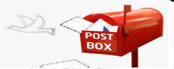
معرفة الرمز البريدي لمناطقك

عند الرغبة في التواصل مع أشخاص من مناطق وبلدات مختلفة سواء لإرسال الأغراض أو الرسائل عبر البريد يكون هناك حاجة ضرورية إلى التعرف على الرمز البريدي للمنطقة التي يقطن بها المرسل إليه حتى يتم الوصول إليه بسهولة وبشكل سريع. إلى جانب العديد من الاستخدامات الأخرى للرمز البريدي، ولذلك فإننا نجد اعتماد كبير على استخدام هذا الرموز في كافة الدول.