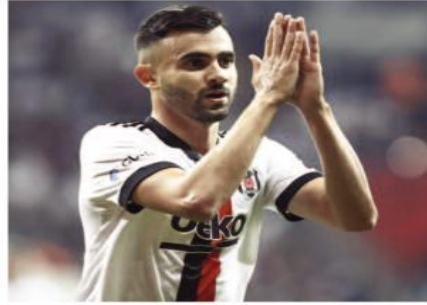
الموسم، وهو ما تسبب في إبعاده عن مسابقات دوري المؤتمر الأوروبي بالإضافة إلى غيابه عن تدريباته مع المنتخب الوطني.

كان قد تعرض لها في فترة التحضيرات. وكشف المصدر ذاته، بأن باشاك شهير وضع لاعب المنتخب الوطني ضمن أبرز أولوياته في فترة الانتقالات الصيفية، يطلب من المدرب إمري بيلوز أوغلو، مشيرا في السورقت ذاته أن مسؤولي الفريق يخططون لإدخال لاعبين في المفاوضات بشأن اللاعب البالغ من العمر 31 عاما.