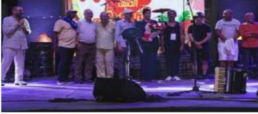
غراغ العيوي والرفيقاوي.