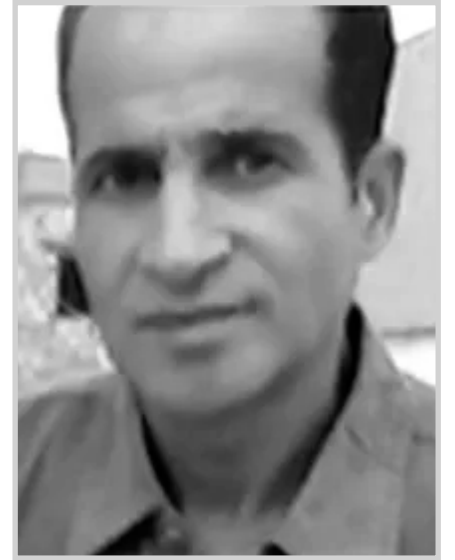
بقلم: جمال نصرالله

الثقافي لتغيرت تطبيقاتها وحتى مناهج عملها.. فتصبح بمعنى التعايش السلمي للأفكار جنباً ونجيب والاستفادة من المتضادات ولا وجود لحكم أو مناصب وكراسي بتاتا كما هو الحال في الشأن السياسي... ثم تنتقل للمفهوم الاجتماعي حيث تصبح أكثر دقة وفاعلية... فهي تعني تجنّب كل أنواع الانحياز والتعصب وكذلك الانفراد بالرأي أو فرضه بأي شكل من الأشكال... بل طرحه بطرق سلمية خالية من الغضب والترفزة والضجيج؟ وهي لعمري الطرائق الحضارية في التعامل... من هنا وجب علينا التعرّيج على حوافي ومدى أثرها داخل المجتمع الجزائري. والذي غالبا ما يوصف عند المشاركة وحتى الأوروبيين بأنه مجتمع قاس وجاف ولا توجد به ليونة أو طراوة تُذكر؟... حيث مظهرها يبدو لك المجتمع جاهزا للعنف... من خلال نوعية الألفاظ أو حتى طرائق خروجها(أي في الشكل والمضمون) إلى درجة أنهم قالوا بأن الفرد الجزائري ليس برجل حوار يعمل على الأخذ والرد. بل يتعنت مع فكرته ويظل متشبثا بها حتى يموت معها وتوت معه؟ وأكيد أن لهذه الظاهرة أسباب جوهرية... من أين جاءت ومتى وكيف وما هي الأسباب التي عملت على حضورها... بل كيف لها أن تظل