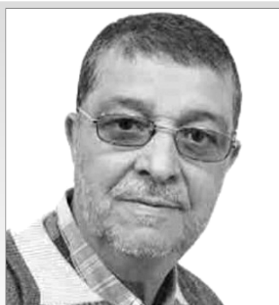
الغنية. هل المعاملة بالطريقة الاقتصادية الإسلامي هي الحل في هذا الظرف؟ بقلم قرار المسعود

الاقتصادية وتخفيف من حدة هيمنة الدولار. ففي الواقع لا النظام الاقتصادي الشيوعي ولا الإمبريالي ولا الرأسمالي القديم والمتجدد وضعوا توازن وعدالة منصفة لاستمرار المعمورة في هذا الجانب. هل عملية تكتل الدول بالمشاركة والمعاملة بعدم الدولار التي تنادي بها البريكس كافية بدون انتهاج خطة يرضى بها الجميع و تساعد الجميع؟ إنها فرصة أجمع عليها أهل الدراية أن تخرج مجموعة البريكس في دورتها 15 بجنوب إفريقيا بتطبيق برنامج يلي رغبات الأغلبية ويخلص الدول النامية من الغطرسة ونهب خيراتها من الدول