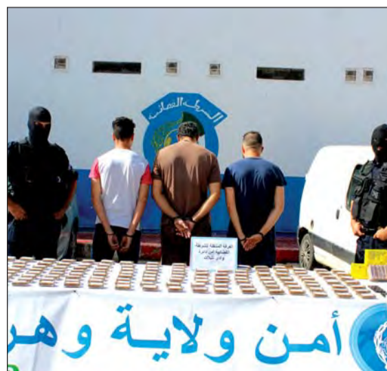
ضدهم إجراء قضائي سيحاولون بموجبه أمام العدالة.

تمكنت عناصر الفرقة المتنقلة للشرطة القضائية BMPJ بأمن دائرة وادي تليلات، من الإطاحة بشبكة إجرامية تتكون من 3 أشخاص، تورط أفرادها في تجارة المخدرات وحجزت 17 كغ و 200 غرام من المخدرات (القنب الهندي)، مبلغ مالي من عائدات الترويج قدره 4 مليون سنتيم و 2 مركبتين تستعملان في نقل هذه السموم. العملية النوعية جاءت بعد المعلومات المتحصل عليها ميدانيا مفادها قيام أفراد الشبكة بترويج ونقل وتسليم هذه السموم، متخذين من مساكنهم وكرا للتخزين، وبعد مراقبة وترصد نشاطهم المشبوه، واستيفاء كافة الإجراءات القانونية مع السيد وكيل الجمهورية لدى محكمة وادي تليلات، واستصدار إذن بالتفتيش والتوقيف وتمديد الاختصاص، أسفرت العملية عن توقيفهم الواحد تلو الأخرى حجز 17 كغ و 200 غرام من المخدرات (القنب الهندي) ومبلغ مالي من عائدات الترويج قدره 4 مليون سنتيم وحجز 02 مركبتين تستعملان في نقل هذه السموم، ليتم تحرير