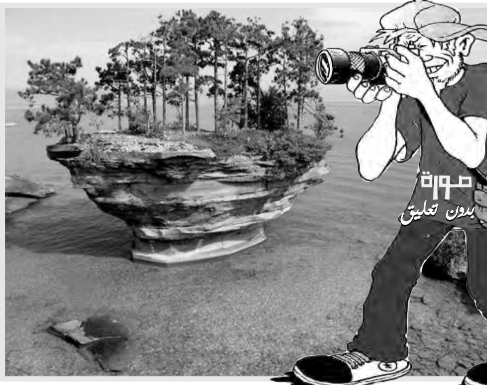
صورة بدون تعليق

ويوضح التقرير المساهمات الاقتصادية في أسواق السياحة الكبرى في العالم، ويكشف عن أكبر خمس اقتصاديات كبرى في السياحة والسفر فيما يتعلق بمساهمة الصناعة في الناتج القومي، وكانت الخمس الدول الأولى هي الولايات المتحدة والصين وألمانيا وبريطانيا واليابان، بينما ضمت قائمة المراكز العشر الأولى أيضا فرنسا والمكسيك وإيطاليا والهند وإسبانيا. ويشمل التقرير أرقام عن مساهمة السفر والسياحة في سوق العمل، ويشكل إجمالي فإن الصناعة ستوظف ما يصل إلى 430 مليون شخص بحلول عام 430، مقارنة بـ 334 في عام 2019، ويمثل هذا تقريبا 1 من بين كل 9 وظائف عالمية. ولا يمثل السفر فقط شريحة كبيرة من الاقتصاد العالمي، لكنه ينمو بمعدل أسرع بكثير من الاقتصاد في المجمل، وقالت جوليا سيمسون، رئيسة مجلس السفر والسياحة العالمية والمسؤول التنفيذي الرئيسي، إن خبراء الاقتصاد يقولون إن الناتج العالمي سينمو على أساس سنوي بنحو 2.6% خلال عام. لكن في السياحة والسفر فإنهم يتوقعون نموا سنويا يبلغ حوالي 5.1%.