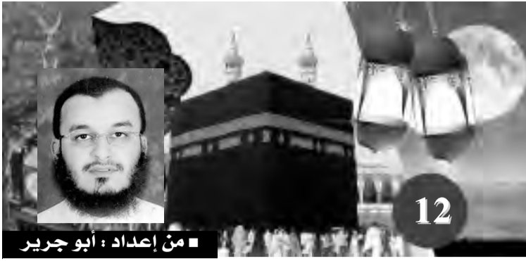
من إعداد: أبو جريير