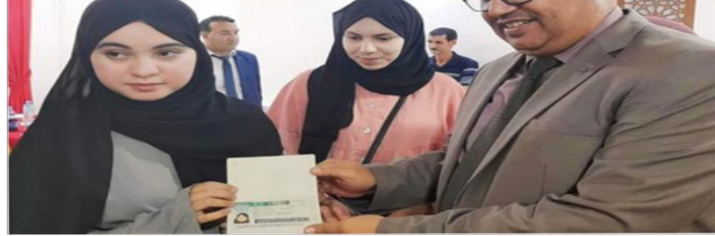
صاحبات المراكز العشر الأولى في شهادة البكالوريا 2023 على مستوى ولاية البيض اخترن تخصص الطب