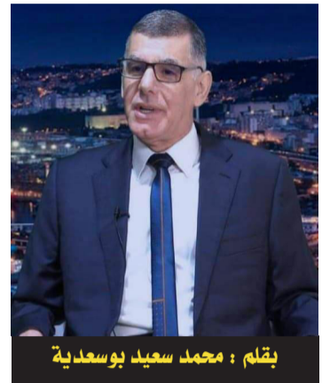
يقلم : محمد سعيد بوسعيدة

عاد الورتيلاني إلى اليمن في سبتمبر 1947، ولم يغادرها إلا بعد قيام الإمامة الدستورية وفشلها. اتبع نفس المسلك في رحلته الأولى أي عدن-تعز-صنعاء، والتقى بنفس الشخصيات مرة أخرى، وكانت عازمة على التوصل إلى اتفاق بالإجماع على مبادئ وطرق التغيير في المستقبل. تعززت العلاقات مع الإخوان المسلمين، عين حسن البنّا ناطقا باسم "الجمعية اليمنية الكبرى" لدى جامعة الدول العربية وحكوماتها. تم تدشين الشركة التجارية، لكن لا يبدو أنها أثارت حماس التجار اليمنيين الذين كانوا لكن الورتيلاني لم يكن يهيمه هذا الشق الاقتصادى بقدر الشق السياسى لمهمته باليمن. يقوم الفضيل بعرض مسودة الميثاق الوطنى على رفيقه الشامى ويخبره أنه حصل بالفعل على انضمام معظم رجالات اليمن. يقوم الشامى بتحرير المسودة بخط يديه والتي تصبح النسخة المتداولة بين مختلف الدوائر المهمة بالتغيير وستكون موضوعا للعديد من التعديلات والإضافات. يتم تنظيم العلماء ورؤساء القبائل والتجار وضباط الجيش في خلايا تتواصل مع بعضها البعض من خلال ضباط الاتصالات