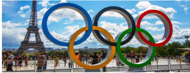
الذي كان متكونا من 39 رياضيا في 14 تخصصا

وأولمبية في بعض التخصصات فقط، فلا نستطيع الطلب من رياضة ليس لها تواجد في المستوى الدولي أن تحقق ميدالية أولمبية، هذا أمر غير منطقي وذلك على غرار ما يحدث في العالم، يستشهد بدول كبرى تمتلك الإمكانيات ولا تستثمر في بعض الرياضات لأنها لا تدخل في ثقافتها، وكرذات المسؤول أن الجزائر ومنذ الاستقلال تحصلت على 17 ميدالية أولمبية منها 05 ذهبيات لأن أقوى العالم يتنافسون في مثل هذه المواهب، لدينا تفرق تاريخي وثقافة في بعض التخصصات الرياضية وهي ألعاب القوى والجيدو والملاكمة، صراحة أنتظر الميداليات الأولمبية من هذه الرياضات وإن تحصلنا على ميداليات في رياضات أخرى ستكون مفاجأة، للتذكير أن الوفد الرياضي الجزائري