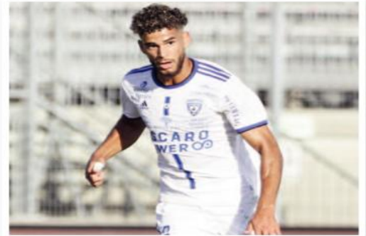
الصلوة ليل الطاقم الفني للنادي الأخضر طالب الإدارة بتعويض صنف الفريق بمذافع جديد، وذلك بعد المشاكل

وكان غيتون محل إطماع نادي لانس الناشط في «الليغ 1» في سداية «الميركاتو» الصيفي الحالي، بعدما تألق بشكل لافت للانتباه الموسم الماضي، حيث اختير كأحد اكتشافات «الليغ 2» بعدما لعب 38 مباراة كاملة سجل خلالها 5 أهداف وقدم 7 تمريرات حاسمة، فيما طالب الإدارة بتعويض صنف الفريق بمذافع جديد، وذلك بعد المشاكل