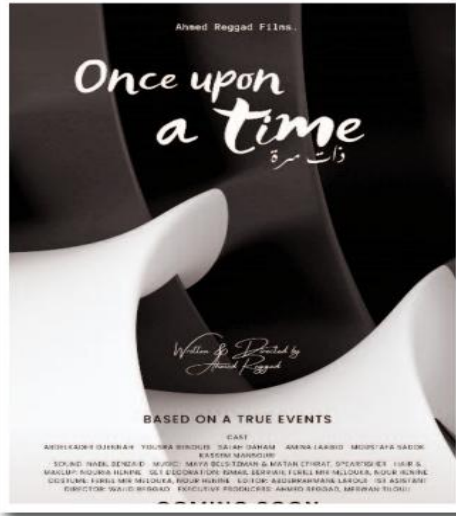
بريطانية تسمى «PAUS.TV» الكبري في المستقبل القريب. كما شارك الفيلم (once) بتصحيح مناقسة للمنصات

دخل أمس الفيلم الجزائري «ذات مرة» للمخرج أحمد رقاد، في المنافسة الرسمية لتعاليات الطبعة السادسة والثلاثين من المهرجان الدولي لفيلم هواة بقليبية (تونس) الذي تتواصل فعالياته إلى غاية 26 من الشهر الجاري.