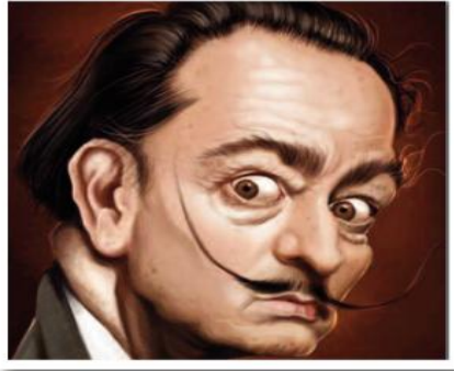
«السريالية هي اللغة الرمزية للعقل الباطن، مع الأحلام والهوس والغيبوبة. هي حقا لغة عالمية لا تعتمد على التعليم أو الثقافة أو الذكاء»

كان دالي مهتما في البداية بالمدرسة التكعيبية والانطباعية. تحورت أعمال الفنان «المضطرب» حول أساسا الأحاسيس والجنس الرمزي والصور الأيديولوجية. عشق «إيلينا إيفانوفنا» الروسية التي كانت متزوجة، والتي أصبحت فيما بعد «الادالي». الشيء المؤسف انه التحق بفرونكو الديكتاتور الغاشم الذي شنت الشاعر العملاق فريديريكو أرسيا لوركا التقدمي الثوري والذي كان قد ارتبط به صديقا. كما انفصل عن جماعة تيار السريالية التي كانت مجموعته تقبل بقوة إلى الأيديولوجية الثورية اليسارية. إن تأثير كتابات وأبحاث سيغموند فرويد على الفنان التشكيلي السريالي بالغة الأهمية، خصوصا فيما يخص «تفسير الأحلام» و «طوطم و طابو» و يذكر أن سبب لقاء دالي بفرويد كان علاجيا لما عناه دالي من الأم اللا شعورية دفعته أحيانا إلى الانتحار لولا «الزوجة الام»، كما تأثر بنسبيتشة وكانت ديكارت. تولد عبقرية في زمانها ثم توت وتأتي عبقرية أخرى ليتمتع البعض بالإبداع الفني ويظل الجنون أحيانا موقدا.