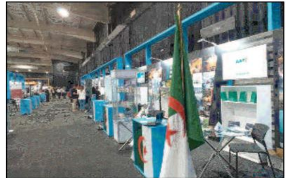
وتشرف مؤسسة «تصدير» (فرع الشركة الجزائرية للتجارة والصناعات الخارجية - صافكس)، على الجناح الجزائري الذي يعبر شايكا وحيدا ويجمع مئتين من عدة هيئات وهي الوكالة الوطنية لترقية التجارة الخارجية (أجلكس)، الجمعية المهنية للتسويق والمؤسسات المالية، الوكالة الجزائرية لترقية الاستثمار، والمرجع العمومي للمؤسسات الناشئة «الجزيرة فور».

ويشارك وزير المالية الجزائري، لعزير فايد في منتدى «بريكس أوتريتش بلاص» المنظم في إطار الدورة الـ 15 لقمة «بريكس»، ممثلا للرئيس الجزائري، عبد المجيد تبون. وتعتبر مجموعة «بريكس» تكتلا تأسس في 2009 ويضم في عضويته كلا من البرازيل، روسيا، الهند، الصين وجنوب إفريقيا التي تحتل أبرز الاقتصاديات الناشئة في العالم. وتحتل المجموعة الآن 32 بالمئة من الناتج المحلي الإجمالي العالمي و42 بالمئة من سكان العالم.