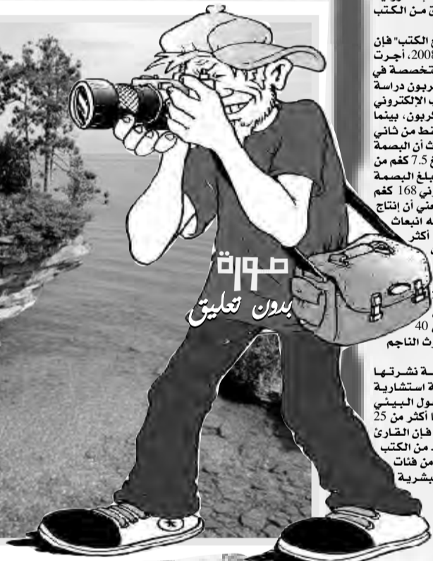
صورة بدون تعليق

وهي جوان 2021، خلصت دراسة نشرت في شركة Heldergeog، وهي شركة استشارية هولندية متخصصة في التحول البيئي للشركات، إلى أنه إذا قرأ شخص ما أكثر من 25 كتابا على مدى خمس سنوات، فإن القارئ الإلكتروني هو الأفضل للبيئة. من الكتب المطبوعة في 25 فنتا من فئات التأثير البيئي، مثل السمية البشرية واستنفاد طبقة الأوزون.