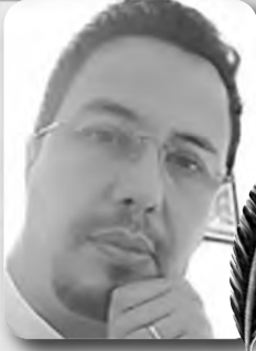
بقلم: حسان زهار