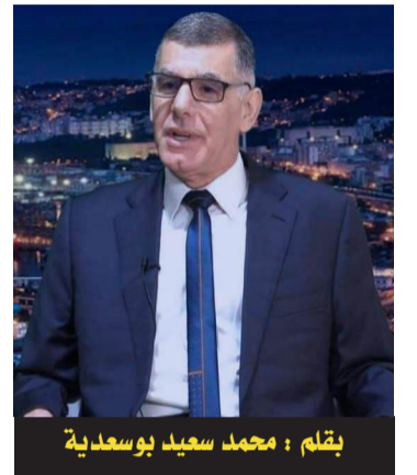
يقلم : محمد سعيد بوسعيدية

لم تكن رحلته إلى القاهرة سهلة المنال. البداية كانت مع سويسرا بمساعدة صديقه شكيب أرسلان، ثم انتقل منها إلى ألمانيا فيطاليا ثم اليونان، ليلتحق عن طريق الباخرة بميناء "بور سعيد" في سنة 1940. سجل بجامعة الأزهر حتى يبرر وجوده بمصر أمام السلطات الاستعمارية الأنكليزية، فنال درجة العلمية، ثم واصل تعليمه بكل من معهدي أصول الدين والشريعة. في سنة 1941 ترأس "بعثة الطلاب الجزائريين" في القاهرة، وفي