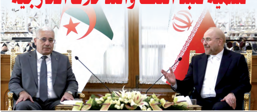
تيسر بل سبل المحادثات الأخيرة القيادية، قائد بوغالي، أكد خلال محادثاته مع رئيس مجلس الشورى الإيراني، فضل الرازي، في الجزائر العاصمة يوم الجمعة 11 أيلول 2023، في إطار العلاقات الاستراتيجية بين الجزائر وجمهورية إيران الإسلامية.

بوغالي يؤكد خلال محادثاته مع رئيس مجلس الشورى الإيراني الجزائر تحرص على حل الأزمات بمقاربة سلمية تتبذ العنف والتدخلات الخارجية