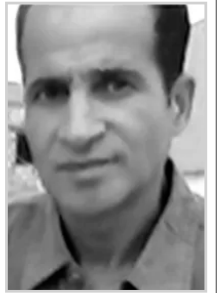
بقلم: جمال نصرالله

فهم أولا وأخيرا بشر مثلنا اجتهدوا في عصرهم وبذلوا جهودا مضنية، ونحن هنا نقدر هذا ونرفع من شأنهم لأننا من دعاة ومناهضي رجال المعرفة والحكمة أينما حلوا وارتحلوا، ولكن هذا لا يعني أننا نسكت إذ وجدنا وعثرنا على زلة أو هفوة لم نخاطر ببالهم يومها، ولم نشر إليها. وقد يتغاضى المرء عن هفوة أو اثنين أو حتى عشرة... لكن الأمر لن يكون كذلك إذ كلما قلبنا صفحاتنا إلا وجدناها متخمة ومليئة بالانزلاقات واللامعقولية... وكذلك نضع فكرة أخرى نصب أعيننا عن أننا هنا لسنا كي نحكمهم، لأن الوسائل التي كانت لديهم ليست هي نفس الوسائل التي هي لدينا اليوم؟ لهذا وجب تقدير هذا العامل المهم... ونعطي مثلا هنا عن العالم المتصوف محي الدين ابن عربي الطائي والذي توجد كثير من الطوائف أبرزها الشيعية تقدسه لدرجة العبادة وزيارة ضريحه بمدينة (قاسيون) السورية. مؤخرا سمعت الشيخ شمس الدين بوروية يجيب عن سؤال من هو ابن عربي فقال (هو العالم الجليل وشيخ الإسلام الأكبر وقد وجب تسجيله والرفع من شأنه) لكن بإجماع الكثيرين ممن قرأوا كتابات ابن عربي خاصة الفتوحات المكية وفصوص الحكم، وجدوا في هذه المؤلفات الكثير من الشطحات التي ليست فقط أقرب للكفر بل هي الكفر بعينه؟! وغير مثال ما قاله الإمام الذهبي (إن لم يكن في كتب ابن عربي كفرا فلا كفر في الدنيا كلها) ويبدو أنه وللأسف الشديد شيخنا شمس الدين لم يقرأ ابن عربي وربما لديه هذين الكتابين (فصوص الحكم والفتوحات المكية) يزين بهما مكتبته ولم يطلع عليهما... وهذه هي نوع المهزلة التي نتحدث عنها؟! أي أنه يعطي أحكاما هلامية تضعه في موضع لا يحسد