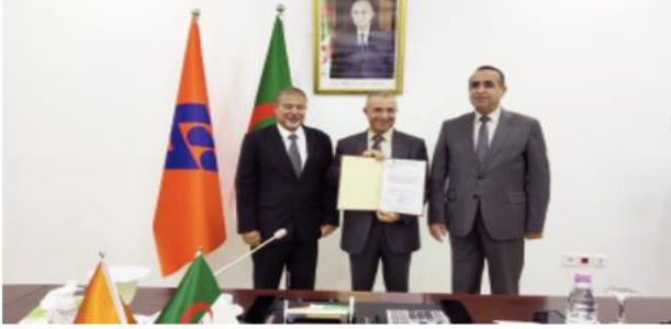
مع جانبه، أثنى الأمين العام للدراسات الوطنية جدوى كل عمليات إعادة التنظيم وهيكلته التي تمت على مستوى سونلغاز خلال الفترة الأخيرة.