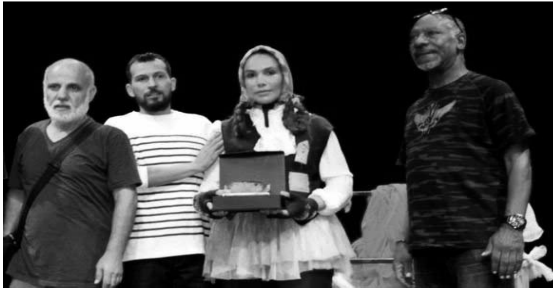
على الخشبة، مقسمة إلى 3 مراحل زمنية قصة فتاة قريباتها، ورغم حالتها الاجتماعية وتناول عرض "ميرا" في 55 دقيقة يتيمة الرالدين تربت في بيت أحد القاسية فامتھنت صنع الدمى من

و عرف المهرجان العربي للمونودرام بالأردن، والذي ترأست لجنته العليا الفنانة الأردنية عبير عيسى، مشاركة 13 دولة عربية بما فيها الجزائر واليمن وليبيا وفلسطين وسلطنة عمان وتونس ومصر والعراق والبحرين وسوريا.