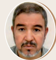
بقلم: أحمد بن السائح ص 08