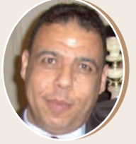
بقلم: د. حسن العاصي ص 9

أنكر استفادة أبنائه من امتيازات للاستثمار في مجال الصحة