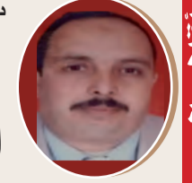
بقلم: سراوي مسعود ص 8