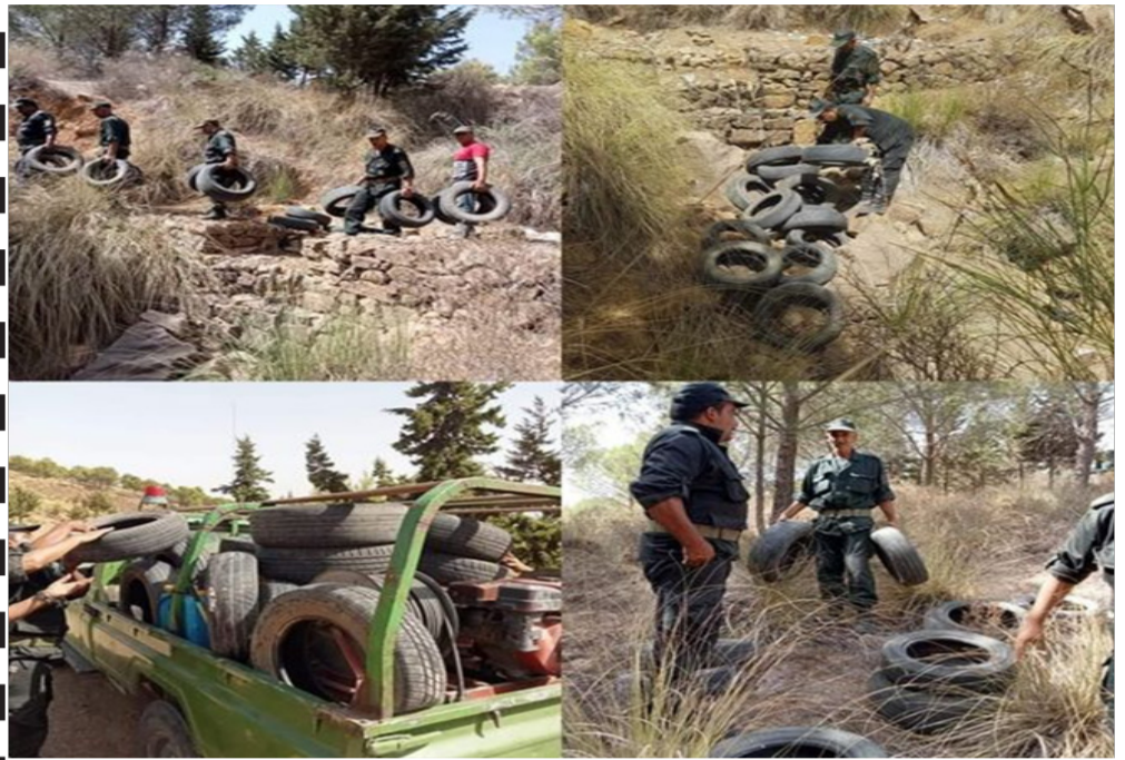
العثور على كميات معتبرة من العجلات المطاطية على مستوى غابة بوعمود بالزبوجة ولاية الشلف.