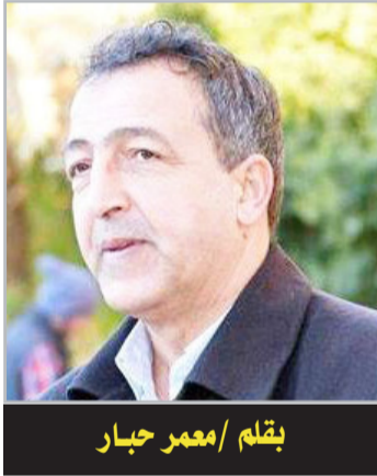
بقلم /معمّر حيار

الكتاب: عباس محمود العقاد "الإنسان الثاني"، هندواي سنة 2014، صدر الكتاب سنة 1912، من 28 صفحة.