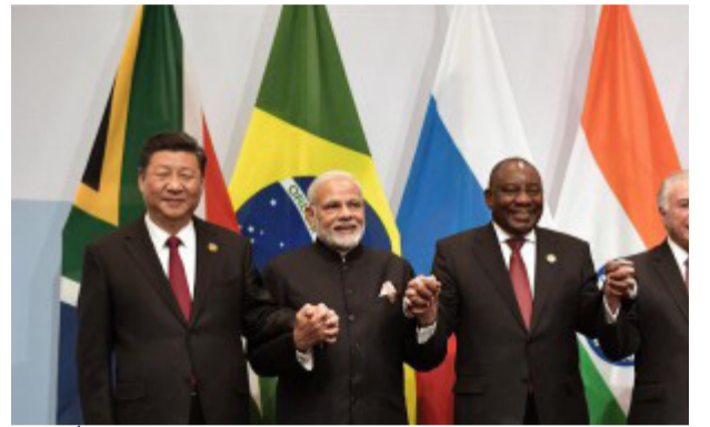
قراءة / محمد علي

دولة على الأقل عن رغبتها في الانضمام إليه بينما 23 دولة قدمت طلبات رسمية لنيل عضويته. عالم "شديد الاستقطاب" وقال مندوب جنوب إفريقيا في مجموعة بريكس أنيل سوكلال إن أحد الأسباب التي تجعل الدول تصطف للانضمام إلى التكتل هو "العالم الشديد الاستقطاب الذي نعيش فيه والذي زاد من استقطابه الأزمة الروسية-الأوكرانية حيث تجبر البلدان على الانحياز" إلى أحد الطرفين. وأضاف أن "دول الجنوب لا تريد أن يملأ عليها من تدعيم وكيف تصرف وكيف تدير شؤونها السيادية. إنها قوية بما يكفي الآن لتأكيد مواقفها". وبحسب سوكلال فإن دول بريكس بعثت الأمل للدول التي تتطلع إلى إعادة رسم "الهيكل" العالمي. وتابع "الأسواق الرئيسية الآن تقع في جنوب العالم (...). لكننا ما زلنا على الهامش من حيث صنع القرار العالمي". ويرأي المحاضر في السياسة الدولية في جامعة ليمبويو ليونغانغ ليغودي فإن العديد من الدول الحريصة على الانضمام إلى المجموعة "تنظر إلى بريكس كبديل للهيمنة الحالية" في الشؤون العالمية. وتم إطلاق تكتل بريكس رسمياً عام 2009. وخلال القمة سيشارك مسؤولون من