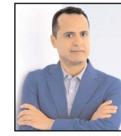
■ بقلم: محمد عبد المقصود

سبقته، بل إن بعض الكتاب اختزل تجارب العمر في رحلات، حوتها متون مؤلفاته، حتى صارت للرحلات جنساً أدبياً بديعاً متفرداً، وذات خصائص، تميزه عن أجناس الأدب الأخرى. ولعل الكثير من القراء يشاركونني بأن هناك تفاصيل ومواقف إنسانية، وحكايات ومشاهد عجيبة، صادفتهم، وتفاعلوها معها، وتأثروا بها، تستحق أن تروى، ويتم الاحتفاظ بها في مكان أمين من الذاكرة. وسواء كان الوطن هو وجهة المسافر، أو بلد يستكشفه للمرة الأولى، أو مكان اعتاد أن يقصده للسياحة والاستجمام والترفيه، سيظل للسفر فوائد جمة، ربما تتجاوز العدد، الذي قيدها به المقولة الدارجة «لسفر سبع فوائد».