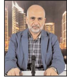
■ بقلم: مصطفى يوسف الداودي

ينظم الفلسطينيون في الوطن وحيث ينتشرون، والعرب والمسلمون والأحرار المؤيدون لهم ولعدالة قضيتهم، مظاهرات واعتصامات، وأن يقوموا بأششطة وفعاليات مختلفة تسلط الضوء على قضيتهم، وتلفت أنظار العالم إليهم، وتدفع المؤسسات الدولية لتحريك قضيتهم والدفاع عنهم.