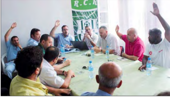
المدافع زرقاوي يلتحق بالمغادرين وهجرة اللاعبين تتواصل

أخرى. وفي سياق آخر، تتجه أعين ومساحم الأنصار الأوفياء للراييد الذين مازالوا يتابعون مستجدات الفريق إلى بيت الشباب الذي سيكون اليوم مسرحا لأشغال الجمعية العامة العادية للنادي الهاوي لسريع غليزان، حيث من المفترض أن يجتمع أعضاء النادي الهاوي من أجل المصادقة على التقريرين