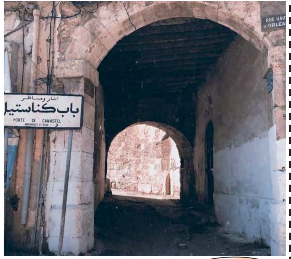
أثار ومناظر باب كناستيل

هناك العديد من الأبواب في وهران، بعضها ورد فقط في بعض الكتب ولا أثر له و بعض لم يذكر ، باب كناستيل إلى جنوب باب عمارة غرب القصر الأحمر لا يزال هذا الباب قائما حتى اليوم وسط الحي العتيق سيدي الهواري أو ما كان يعرف قديما بالحي الإسباني، ويعود تاريخ تشييده إلى عهد المرينيين وهو ضمن المصنفات الوطنية في سنة 1952 . كانت بداية الاهتمام بالقبصيات والأبواب منذ عهد السلطان المرينيين، فتروكا لنا آثارا عديدة من المدن بما حوته من أسوار وأبواب وعمران، ولعل هذه الأبواب التي نجدها في كثير من المواقع التاريخية والأثرية أهم القلاع الشاهدة على فخامة العمران يومها ومضاهاته للعمارة الأندلسية . هذا الأخير كان يتقدمه جسرا كبيرا يؤدي إلى معبر "كناستيل" الذي أصبح يسمى في الوقت الراهن شارع بن عمارة بودخيل في ذات الحي ، و يعد معلما تاريخيا ومعماري في المدينة .