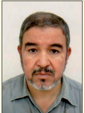
أحمد بن السائح

(يوم المجاهد) هو التسمية المناسبة لهذا اليوم الساطع في تاريخ الثورة التحريرية، التي حققت في هذا اليوم الخالد طائفة من الانتصارات المظفرة، بفضل تلك الهجمات الدقيقة المحكمة التنفيذ، كان هذا اليوم الأجل يوما مشهودا لضرب روائع الأمثال في التحصية والمفاداة والتحدي، إنه اليوم الأجل كما ((...)) جل فينا جلال نوفمبر)) من قبل.. هو يوم فارق في تاريخ الثورة الثائرة على مظالم الكولونيالية الطاغية، باستبادهها الغاصب الذي فرض هيمنته الفاضحة، وراح يوسّع من دائرة بغيه واستكباره في كل أنحاء الجزائر على مدى قرن وزيادة.