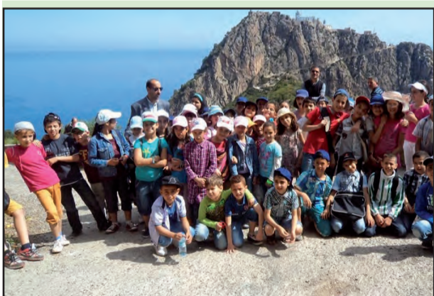
المبادرة التي تهدف إلى تحفيز وتشجيع التلاميذ والطلبة على تحقيق النجاح والتفوق في الدراسة أحسن مرزوق

بادرت جمعية "نفرما" الناشطة بقرية تسالة بلدية تاغزوت شرق ولاية البيورة إلى تكريم التلاميذ المتفوقين في الامتحانات الرسمية في شهادتي التعليم المتوسط و البكالوريا بطريقة خاصة خارج القاعات، وذلك بتنظيم رحلة سياحية واستكشافية إلى مختلف المناطق الساحرة التي تزخر بها ولاية بجاية، حيث استمتع التلاميذ طيلة يوم كامل بزيارة كل