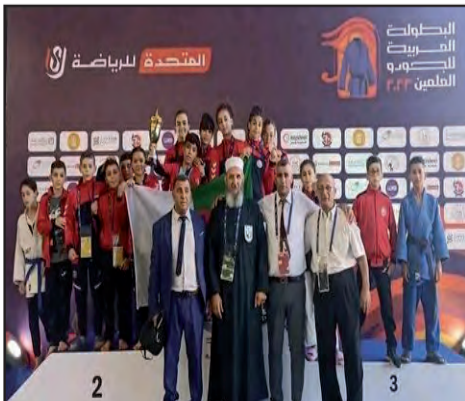
تجمعت الجماهير أمام المركز الثقافي لتقديم التهانئ للأبطال، وتواصلت الاحتفالات إلى غاية ساعات متأخرة من الليل، ومن جهتهم عبر أعضاء