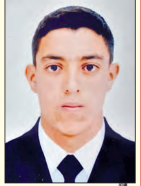
بقلم: الطالب فرحاني عادل / جامعة العربي التبسي تبسة

لقد كانت ثورة أول نوفمبر 1954م بمثابة المفاجأة التامة لدى السلطات الاستعمارية الفرنسية، جعلتها تتخذ العديد من الإجراءات القمعية للقضاء عليها في مهدها، ونتيجة لذلك سعت قيادة الثورة لجبايتها على مختلف أصعدتها خاصة العسكرية منها، فكانت هجومات 20 أوت 1955م دليلا واضحا على ذلك وتأكيدا على صلابة وقوة جبهة وجيش التحرير الوطني ومحطة حاسمة لبداية نهاية أسطورة الجزائر الفرنسية.