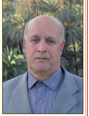
إم : إد / أ / الأخضر رحمني

والجزائر تحتفل بالذكرى المزدوجة ليوم 20 أوت المخدلة لإحداثين بارزين في تاريخ الثورة التحريرية هما : ذكرى هجومات 20 أوت 1955 بالشمال القسنطيني، و 20 أوت 1956 ذكرى انعقاد مؤتمر الصومام بقرية إيفري، نتذكر شخصية بارزة كان لها الفضل الكبير في التخطيط وتنفيذ الهجومات التي عرفها شمال الشرق الجزائري، حتى اعتبر أنه عقلا المفكر وقائدها الناجح. كما كان من بين قادة الثورة الذين حضروا أشغال مؤتمر الصومام، ولعب دورا رئيسيا خلال اجتماعاته، وفيه تمت ترقيقته إلى رتبة عقيد.. إنه القائد البطل الشهيد زيغود يوسف الذي سنسلط الضوء على بعض المحطات من حياته ومسيرته النضالية، لتذكير شباب اليوم بمنافيه الحميدة وخصاله البطولية حتى يخلده في الذاكرة الجماعية، ويتشبع هذا الجيل بمبادئ الثورة، ويعتز بقيمتها السامية، فيتخلى بالروح الوطنية والتفاني في خدمة الوطن، والتمسك بوحدته والمصير المشترك لأبنائه.