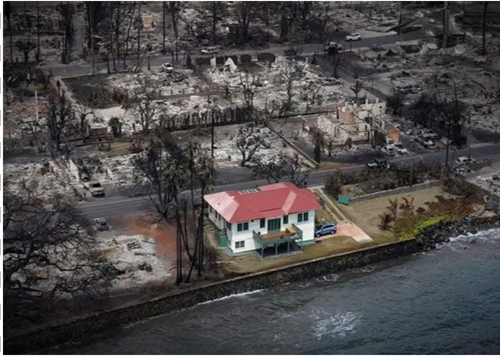
صورة لمنزل ينجو وحيداً من حرائق هاواي تثير الحيرة