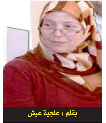
بقلم: عالجية عيش

لم يعد الكلام حول من يقتل من في الجزائر بقدر ما عاد الكلام حول من يجاسب من؟ الصامتون عن التاريخ؟ أم الضائون له؟، فالأحداث التي شهدتها الجزائر خلال السنوات الأخيرة تتطلب من الجميع مراجعة دقيقة مع الذات قبل كل شيء، ثم الوقوف في تفاصيل ما يحدث وما المقصود من وراء ذلك، ومعرفة من هم الذين لهم ضلع فيها وهذا يعني وضع النقاط على الحروف، لأن الأحداث كلها جاءت متشابكة ومتراصة تدور حول قضية واحدة وهي ضرب مرجعية الجزائر الثورية، لاسيما وأن هذه الأحداث