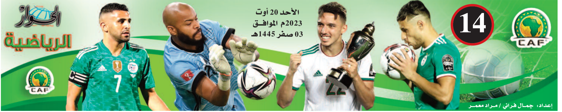
إعداد: جمال فراني / مراد معمور