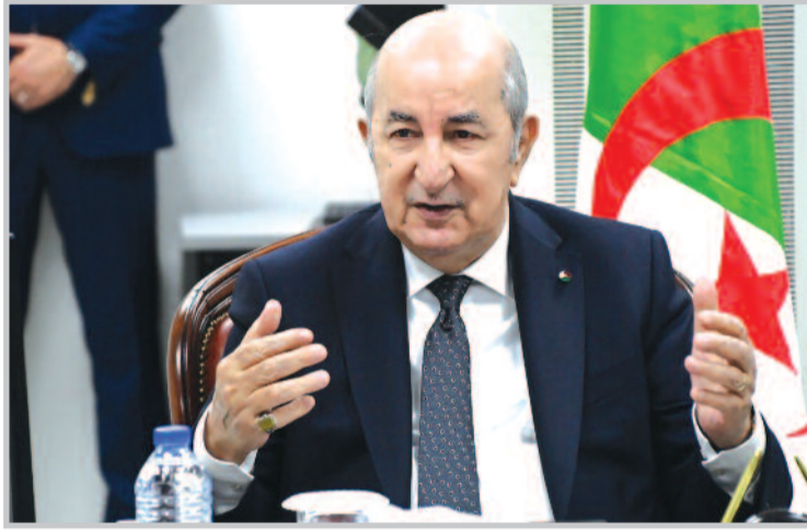
وأضاف رئيس الجمهورية بالقول: "إننا في الوقت الذي نحيا فيه الذكرى المزدوجة للاستثمارات، ولتأكيد حضور الجزائر القوي وتأثيرها إقليمياً ودولياً".

وأكد الرئيس تبون أنه من خلال الاحتفاء بالذكرى المزدوجة تتجدد "مشاعر الاعتزاز بالانتماء لوطن صنع كبرياءه الشهداء الأبرار، الذين أودعوا في الأجيال بذرة الوفاء لرسالة نوفمبر الخالدة وأورثوا شبابنا خصالاً تغذي فيها الوعي الوطني، والغيرة على بلد خاض حرباً مريرة ضروراً من أجل الاعتناق.. ودفع ثمن الحرية دماً غالياً مقدساً".