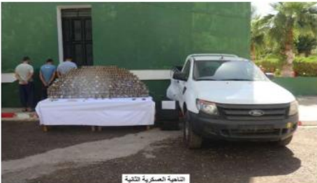
تغطية عسكرية لتبسة

كشفت الحملة الحربية التي أوردتها أمس وزارة الدفاع الوطني أنه في سياق الجهود المتواصلة للحد من مخبأة الإرهاب ومحاربة الجريمة المنظمة بكل أشكالها، نفذت وحدات ومضارز للجيش الوطني الشعبي خلال الفترة الممتدة من 09 إلى 15 أوت الجاري عددا من العمليات التي أسفرت عن تنازع نوعية تعكس مدى الاحترافية العالية واليقظة والاستعداد الدائمين لقواتنا المسلحة في كامل التراب الوطني، وفي إطار مكافحة الإرهاب أوقفت مضارز للجيش الوطني الشعبي 03 عناصر دعم الجماعات الإرهابية في عمليات متتصلة، فيما تم كشف وتدمير مخبأ للإرهابيين بتبسة كان يحتوى على تضارتي ميدان وأغراض مختلفة.