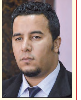
بقلم د. محمد مرواني

رغم اجتهاد بعض المؤسسات في نطاق الاشغال والأعباء على تكوين متحدثين إعلاميين باسم المؤسسات أو مكلفين بعملية الاتصال بأجهزة الصحافة ما زال "المتحدث الإعلامي" وظيفة تمارس في مساحات مهنية محدودة رغم التحولات المتسارعة التي يشهد حقل الاتصال والإعلام والعلاقات المؤثرة والمتأثرة.