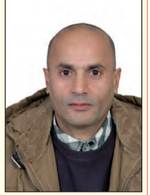
خلف الله سمير

كل من الوليد بن المغيرة المخزومي، وحبيب بن عمرو بن عمير الثقفي، لا لشيء إلا لأنهما، من جهاء قومهما، ولأن محمد ص كان فقيرا، في مرحلة ما من مراحل حياته، والغنى والثراء كانا ولا يزالان، معيار تصنيف وتفضيل، وتقديم وتأخير هذا وذلك، ونحن هنا لا ننكر فضل المال، ولا نعيبه ولكننا نرفض أن يكون العامل، الوحيد لتحديد قيمة البشر، وماذا لو أن كفار قريش، نجحوا في قتله ص، الشيء المؤكد أن البشرية، كانت ستخسر الشيء الكثير، الذي لا يمكن تعويضه أبدا، محمد النبي ص لم يعترف به قومه، وجل أصحاب الشريعتين السابقتين، لكون النبوة حسبهم، محصورة في بني إسرائيل، ولا يمكن أن يكون، هناك نبيا من غير نسلهم، وبالتالي فما من مجال، للاعتراف بشرعيته كنبى، لأنه من نسل إسماعيل ع، الذي يرمز إلى الآخر، وإلى ابن الجارية، الذي لا حق له في التواجد، وهذه هي الخطيئة التي لا يجب، أن نعيدها اليوم في الجزائر، وعلى أساسها نقيص، شرائع واسعة من المجتمع، لأن دماءها ليست زرقاء.