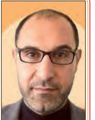
بقلم: حسن لافي

في "وحدة الساحات" عملت إسرائيل على توجيه ضربة قاسمة لحركة الجهاد الإسلامي، والقضاء على جهازها العسكري، بعد أن حملت الحركة عبء استنهاض المقاومة في الضفة الغربية.