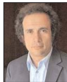
بقلم: عمرو حمزاوي

في أقاليم بعينها) الاختيار بين التوجه نحو واشنطن وبين الذهاب إلى بكين من أجل تطوير علاقات تحالف تشمل العناصر الاقتصادية والتجارية والعسكرية والتكنولوجية ومعها التعاون الدبلوماسي وضمانات الأمن الثنائية (أي المقدمة من أي من القوتين العظميين إلى دولة بعينها) ومتعددة الأطراف "أي المقدمة من واشنطن أو بكين إلى مجموعات من الدول أو إلى تجمعات إقليمية تضم في عضويتها أكثر من دولة". وبينما تبدو أوروبا وكندا واليابان وكوريا الجنوبية في خانة التحالف الشامل مع الولايات المتحدة وتلتزم روسيا بالشراكة الاستراتيجية الكاملة مع الصين، تدرك واشنطن أن القوى الكبرى الأخرى كالهند والبرازيل والقوى الوسيطة التي صارت تنظم في تجمعات إقليمية عديدة (كآسيان وبريكس وشنغهاي وتحالف كواد ومجلس التعاون الخليجي وغيرها) وأبرزها اليوم ماليزيا واندونيسيا وجنوب إفريقيا والمكسيك وبعض دول الشرق الأوسط، تفتش عن سبل للمزج بين التعاون مع القوتين العظميين. غير أن الولايات المتحدة، ولأنها تتأرجح اليوم بين تفضيل سياسات وتكتيكات صراعية تجاه الصين وبين اعتماد خليط من سياسات التعاون مع الإبقاء على التفوق الأمريكي (عسكريا وتكنولوجيا) ومن تكتيكات احتواء الصين (اقتصاديا وتجاريا ودبلوماسيا وأمنيا) مع الابتعاد عن التصعيد الشامل، لم تحسم أمرها بعد فيما يخص كيفية وحدود تخييرها لسقوط الكبرى والوسيطية ومدى استعدادها للنتائج المتوقعة. وفي تأرجحها، تتجاهل واشنطن أن بلدان العالم الواقعة بينها وبين بكين لا تقع فقط في محل المفعول به وأنها قد تمتلك من مصادر القوة والأدوات التفاوضية ما قد يمكنها من فرض إرادتها على القوتين العظميين في بعض القضايا والأحيان.