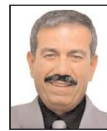
بقلم: حمادة فراعة

لبنان اليوم بلد بدون رئيس منتخب وحكومة مؤقتة بلا صلاحيات، بعد فشل نظام التوازن الطائفي القائم على نتائج الاقتراع، وهيمنة طائفة مسلحة تمكنت من السيطرة التي تكاد تكون منفردة في إدارة النظام الفاشل، يشاركها في ذلك ضعف الآخرين وتراجع دورهم. لبنان المعذب يحتاج لانتفاضة، لثورة شعبية عابرة للطوائف على قاعدة المواطنة الواحدة لكل مواطني لبنان من أجل العدالة والمساواة والتكافؤ بعيداً عن المحاصصة والامتيازات الطائفية المنفردة، فتمتد يَفْلح وينجح وينتصر. 99.