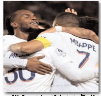
يخاض الأرجنتيني لهندرو بارديس والبرتغالي ريناتو سانثيز باريس سان جيرمان الفرنسي إلى

روما الإيطالي، حسب ما أفادت الإثنين الصحافة المحلية. وحسب صحيفة "غازيتا ديلو سبورت" سيصل لاعباً خط الوسط إلى العاصمة الإيطالية الثلاثاء، من أجل الزيارة الطبية الاعتيادية وتوقيع عقدهما. وسيقع بارديس (29 عاماً) الذي سبق له أن ارتدى قميص روما بين عامي 2014 و2017 ودافع عن ألوان مواطنه جوفنتوس الموسم الماضي في "سيريا أ" على عقد لمدة عامين، مع خيار التمديد لعام إضافي. وقدرت صفقة بطل موندبال قطر مع الأرجنتين في ديسمبر الماضي، بحوالي 2.5 مليون يورو، إضافة إلى 4 ملايين مكافآت. وانضم بارديس إلى سان جيرمان في جانفي 2019 مقابل 47 مليون يورو قادماً من زينيت سان بطرسبرغ الروسي، وخاض 117 مباراة بقميص