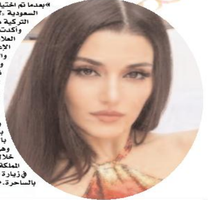
في زيارة الصحراء التي وصفتها بالأسيرة.

وأضافت أخرى، «نرى وجهها الجميل في كل مكان». بعد اختيار جورجينا كوجه اعلاني للعطر السعودي، ظهرت خلال مقطع فيديو رويت بالجمهور به باللغة العربية، حيث قالت في بداية الإعلان، «مرحباً أنا جورجينا، حيث ظهرت وهي تجلس في مجلس عربي داخل خيمة تراثية، وأردت رأسها بوشاح من الشيفون الأسود. خلال مقطع الفيديو تحدثت جورجينا عن العادات والتقاليد والكثير الراحة والأمان داخل المملكة العربية السعودية، والقيم العائلية القوية، وتجربتها