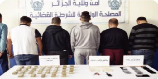
ب.ر. وأفاد بيان للمصالح ذاتها، أن قضية الحال جاءت استغلالا لمعلومات أمنية وردت إلى الأمن الحضري الرابع بالقبة مضادها وجود مجموعة من الأشخاص المشتبه فيهم بعدة أحياء يتاجرون في المخدرات ويحاولون بسط نفوذهم وبث الرعب وسط سكان الحي. وأضحت التحريات إلى توقيف المشتبه فيهم اللذين كانوا محل بحث في عدة قبضات لترويج المخدرات وبعد القيام

سلاح أبيض، مبلغ مالي قدر بـ 284450 دينار من عائدات الترويج، كلب شرس يستعمل كسلاح موجه للتعدي واثنين من الشماخيخ. وتم تقديم المشتبه فيهم أمام النيابة المختصة إقليميا وفق ملفات إجراءات جزائية عن قضائية تكوين جماعة أضرار الغرض المتجارة في المخدرات والمؤثرات العقلية الجارية على أسلحة بيشاء محظورة من الصنف السادس دون مرور شرعي.