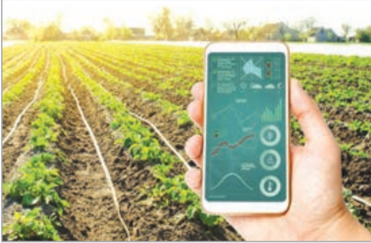
مستقبل واعد للجزائر في التكنولوجيا الزراعية الحديثة

● عباس: تحد كبير في انتظار الشراكة مع الألمان لتوسيع المزارع الذكية