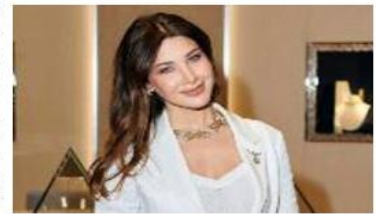
نانسي عجرم تطلق تحدي الصيف مع «تيجي نبيسط»

منجته نحو حمام السباحة برفقة أصدقائها، من كليب «تيجي نبيسط». ودعت نانسى متابعيها بكلمات مليئة بالحماس والتحدى، إلى نشر أفضل وأجمل لقطة داخل حمام السباحة على حساباتهم الشخصية، معلقة «من معقول يعمل مثلنا وينبسط بحمام السباحة؟»