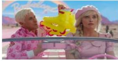
الإيحاءات التي يضمنها. للإشارة انطلق عرض «باربي» غرضه غربا جروج في قاعات السينما الجزائرية في 19 جويلية الماضي.

قررت وزارة الثقافة والفنون رسيا سحب ترخيص عرض الفيلم من قاعات السينما الجزائرية بعد الجدل واللعط الذي أثاره فيلم وأكثرت جهات مطلعة، أن الوزارة قامت بسحب ترخيص عرض فيلم «باربي» الممنوح لشركة «أم دي سي» للتوزيع. من جانبها الشركة الموزعة قامت بحذف الفيلم من برنامج عرضها الأسبوعي المشور عبر صفحتها الرسمية على موقع التواصل الاجتماعي «فيسبوك». الأمر ذاته قامت به الصفحة الرسمية لقاعة السينما «كوسوس» بالرياض الفصح حيث أشارت إلى أن برنامج العرض الجديد يحلو من الفيلم الأمريكي. وجاء قرار التوقف بعد موجة الجدل الذي أثارها الفيلم الذي اعتبر صافيا لقيم وأخلاق المجتمع الجزائري، خصوصا أنه موجه لفة الشباب والأطفال. الفيلم الذي حول العالم للون الوردي أحدث جدلا كذلك عبر مواقع التواصل الاجتماعي في العديد من البلدان العربية والأسبوية، التي صنعت عرضة هي الأخرى بسبب المشاهد