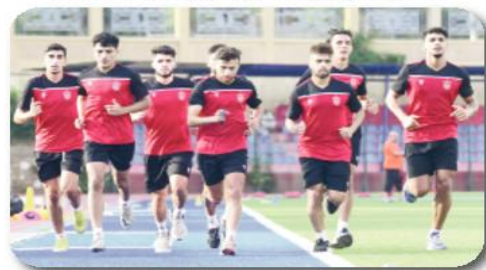
إلقاء العاصمة يلقي ترحيبه التحضيري أنهى فريق اتحاد العاصمة أمس، ترحيبه التحضيري بإجرائه مباراة تطبيقية في ملعب عمر حمادي.

كشفت تقارير صحفية عن تفاصيل جديدة بشأن مباراة كأس السوبر الأفريقي 2023، المقرر إقامتها بين الأهلي المصري واتحاد العاصمة.