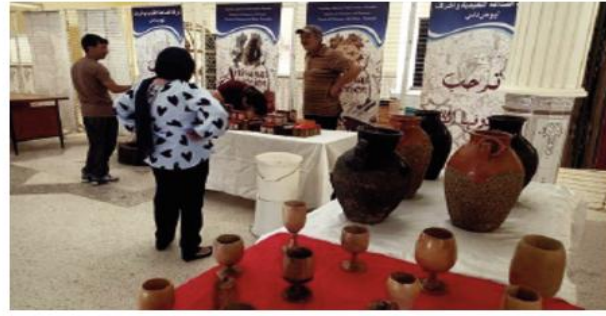
الأخيرة من محلات تسويقية عبر الولاية، حسب واستفاد، في إطار برنامج الإعانة على التأهيل وترقية الحرف التقليدية الممارسة، ما لا يقل عن رئيس الغرفة.

770 حرفي من دورات تكوينية في ميادين مختلفة على غرار التسيير التقني لإنتاج المواد والخدمات وصناعة الجلود والفضة والخزف الفني والنسيج. ومن جهة أخرى، سجل لخضاري بأن غالبية الحرفيين المخترطين أو المسجلين رسميا في الغرفة يغلب على مهنتهم الطابع العائلي وينتشرون بالخصوص عبر بلدات شرق الولاية، وهي بني عمران وسوق الأحد والثنية ودرس وأعقير. يذكر أن صالون الصناعة التقليدية والحرف الذي انطلق منتصف شهر يوليو الماضي سيتواصل إلى غاية نهاية الشهر الجاري بالجديفة العمومية المنصر بواجهة البحر لمدينة بومرداس وتعرف مشاركة 24 حرفيين من داخل وخارج الولاية وتهدف المتظاهرة إلى تشجيع المبادرات الشبانة في مجال الصناعات التقليدية والحرف اليدوية والتعريف بمختلف المنتجات الحولية وتوفير مكان لائق للحرفيين من أجل تسهيل عمليات تسويق منتجاتهم.