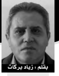
بقلم : زياد بركات