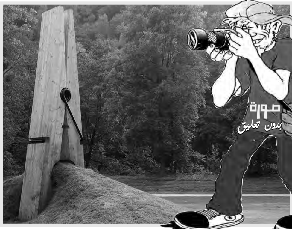
صورة بدون تعليق

أظهر استطلاع للرأي أجرته شركة "أصداء بي سي ديليو" أن أكثر من نصف الشباب العربي في دول شرق المتوسط وشمال إفريقيا يحاولون الهجرة من بلدانهم أو يفكرون جديا في ذلك، ووفق الاستطلاع - الذي نشرت نتائجه قبل أيام - فإن 53% من المستجوبين في دول شرق المتوسط، و48% في دول شمال إفريقيا يريدون مغادرة بلدانهم لبحث عن فرص أفضل ولا سيما فرص العمل، أما الجهات المفضلة للراغبين في الهجرة فهي كندا (34%)، ثم الولايات المتحدة (30%)، وألمانيا والمملكة المتحدة (20% لكل منهما)، وفرنسا (17%). وتأتي التطلعات للهجرة في سياق مشهد اقتصادي قاتم في العديد من الدول العربية، إذ قال 72% من الشباب في شرق المتوسط (العراق، الأردن، لبنان، فلسطين، سوريا، اليمن)، و62% في شمال إفريقيا (الجزائر، مصر، ليبيا، المغرب، السودان، جنوب السودان، تونس)، إن اقتصاد بلدانهم يسير في الاتجاه الخاطئ، لكن رغم أن العوامل الاقتصادية كانت السبب الرئيسي للغبة في الهجرة، فقد كشف الاستطلاع عن دوافع أخرى ذات طابع أممي وسياسي.