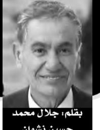
بقلم : جلال محمد حسين شنوان