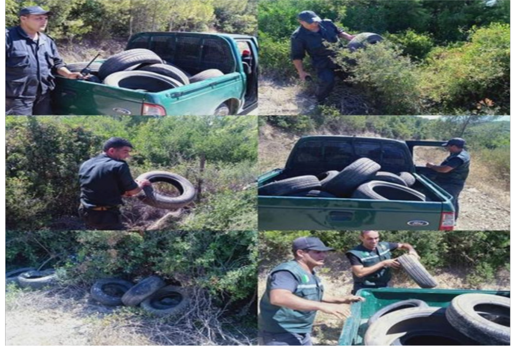
العثور على كمية هائلة من العجلات المطاطية عبر محيط وداخل غابة جبل قرواط بتيبازة مجهزة لحرق الغابة

توفيت امرأة وإبنتها غرقا في سد سوبلة في مقرة بالمسيلة. و أوضح بيان لمديرية الحماية المدنية ، أن الحادث يتعلق بامرأة تبلغ من العمر 29 سنة وإبنتها البالغ من العمر حوالي 5 سنوات . و تدخل أعوان الوحدة الثانوية للحماية المدنية بمقرة مدعومين بفرقة الغطاسين للوحدة الرئيسية، لإنتشال جثة الطفل من طرف مصالح الحماية المدنية . فيما تم إنتشال جثة المرأة، حسب تصريحات شهود عيان، من طرف مواطنين وتحويلها إلى مستشفى بلدية صالح باي إقليم ولاية سطيف قبل وصول الإسعافات