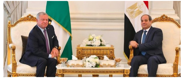
قراءة / محمد علي

ومصر مصطفى مدبولي، وشهدت توقيع 12 اتفاقية بين البلدين بمجالات مختلفة. وذكر البيان أن ملك الأردن "جدد التأكيد على الحرص على توفير كل سبل الدعم للأشقاء الفلسطينيين في نيل حقوقهم العادلة والمشروعة، ومواصلة الجهود لكسر الجمود في عملية السلام للتوصل إلى حل عادل وشامل على أساس حل الدولتين". وأشار إلى أنه "تم التأكيد على أهمية مواصلة التشاور والتنسيق إزاء مختلف القضايا ذات الاهتمام المشترك، بما يحقق مصالح البلدين والشعبيين الشقيقين، ويخدم القضايا العربية". وفي وقت سابق أمس الاثنين، وصل الملك عبد الله الثاني إلى مدينة العلمين لعقد قمة تجمعها بالرئيسين المصري عبدالفتاح السيسي والفلسطيني محمود عباس. وذكر الديوان الملكي الأردني، في بيان، أن