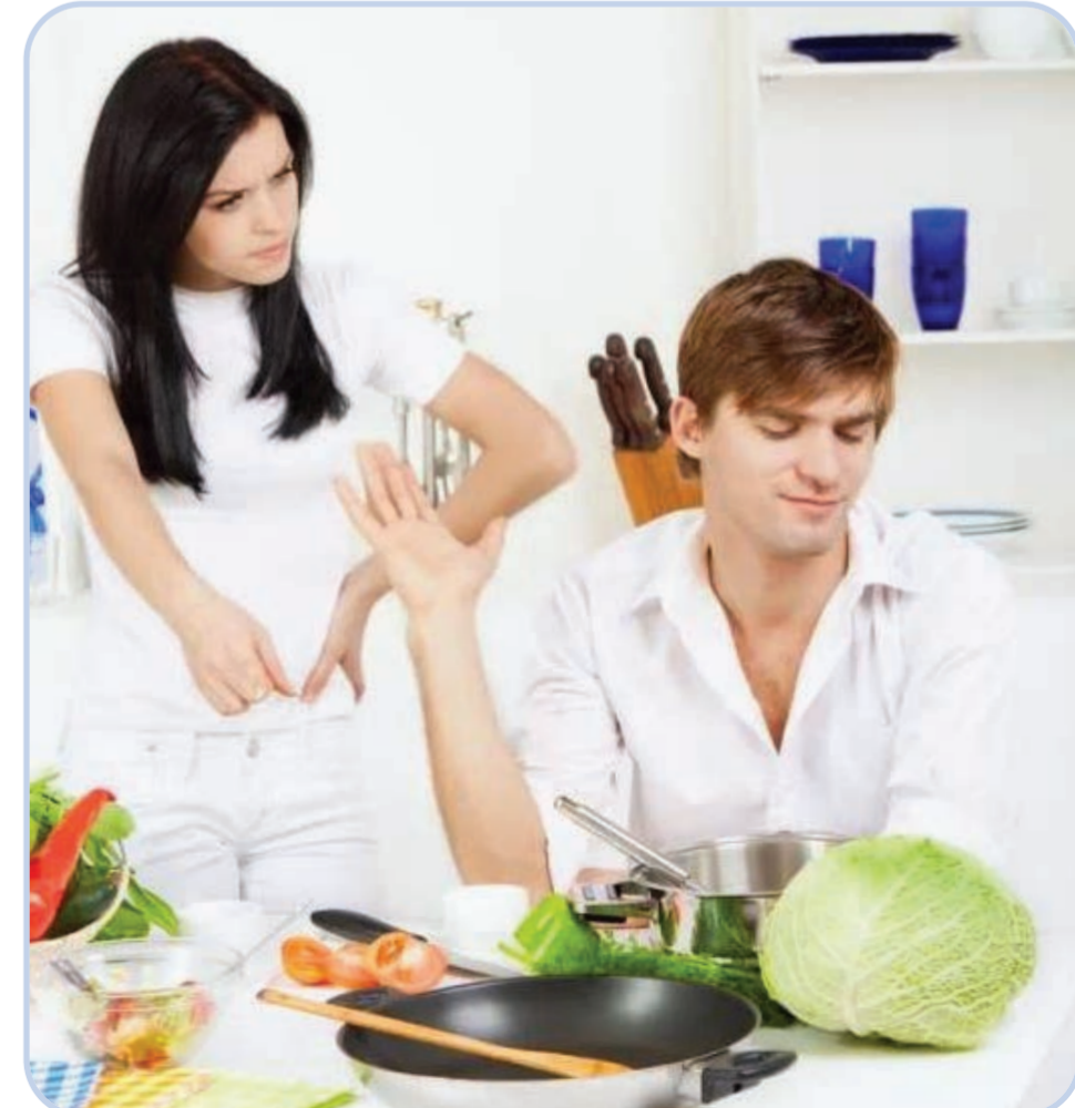
روبورتاج / ثورة حرث

خلال فترات زمنية سابقة برزت نقاشات عديدة ومثيرة للجدل كان أبطالها أشخاص يحملون أفكارا جريئة تخص الأسرة العربية المسلمة وتشكك في مقوماتها وأركانها وأساسها الذي بنيت عليه منذ قرون خلت، مؤكدين أن لادرج ولا عيب في إبداء الرأي والاجتهاد، ومع تطور وسائل الإعلام ومواقع التواصل الاجتماعي اشتد وقع هذه الدعوات واتسع حجم تأثيرها بالشكل الذي أوجب الرد عليها.