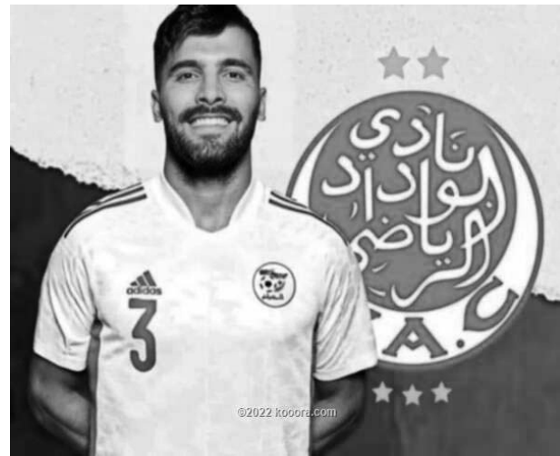
ايت عمار محمد

أعلن باريس سان جيرمان الفرنسي، إيقاف الحرب الدائرة بين كيليان مبابي، نجم الفريق، وناصر الخليفي، رئيس النادي. وأصدر بي إس جي بياناً رسمياً أمس، يقول: "بعد محادثات بناءة وإيجابية للغاية بين الإدارة ومبابي قبل مباراة الفريق مع لوريان، تم إعادة دمج اللاعب في التدريبات هذا الصباح". وكانت الإدارة الباريسية قد عاقت مبابي باستبعاده من الجولة الآسيوية، التي خاض خلالها الفريق 4 مباريات ودية. وبعد العودة من كوريا الجنوبية واليابان، بقي مبابي يتدرب مع مجموعة اللاعبين المستبعدين والمعروضين للبيع خلال فترة الانتقالات الصيفية الجارية. ولجأت الإدارة لهذه القرارات، من أجل ردع مبابي الذي رفض تجديد عقده الذي ينتهي في صيف 2024، وبصر على الاستمرار مع الفريق للموسم المقبل. ويحاول الخليفي ومسؤولو سان جيرمان إيجاد حل لهذا الموقف الشائك، تفادياً لرحله مجاناً بعد عام. وتردد كثيراً خلال الآونة الأخيرة، أن صاحب الـ (24 عاماً) لديه اتفاق مع ريال مدريد، يتضمن الانتقال إلى صفوفه مجاناً الصيف المقبل