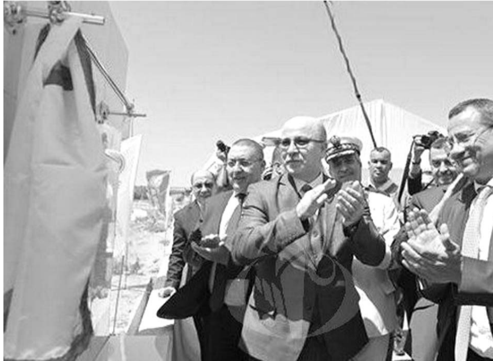
■ محمد ج

دعا الوزير الأول، أيمن بن عبد الرحمان، أمس السبت بالطارف، إلى الإسراع بتفعيل وحدات صيانة الطريق السيار شرق-غرب والقيام بالصيانة الدورية له بهدف المحافظة على هذا المشروع الحيوي.