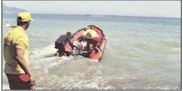
هذه من بين 24 على مستوى شواطئ البحر.

وفي إطار برنامج الوقاية السنوي المسطر من طرف مصالح المديرية العامة للحماية المدنية المتعلقة بالحملات التحسيسية والتوعوية من أخطار موسم الإصطياف وللتقليل من حدة هذه المخاطر ونشر التدابير الوقائية بين مختلف فئات المجتمع، تقوم المديرية العامة للحماية المدنية عبر مختلف ولايات الوطن بأيام تحسيسية ووقائية في مختلف الأقطار وهذا عبر المساجد، الإذاعة، الأماكن والساحات العمومية، حيث برعت آيما تحسيسية للوقاية من أخطار الغرق في المسطحات المائية ومحيطات السقي الفلاحي للسدود، الحواجز المائية الأخرى.