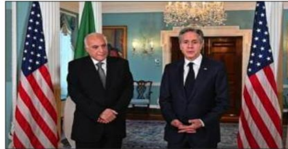
كل سياسي للصحراء الغربية». كما هنا السيد بيلينكن نظره السيد عطايف - يضيف السيد ميلر - بمناسبة انتخاب الجزائر عضوا غير دائم في مجلس الأمن الدولي، مبديا «رغبة الولايات المتحدة للعمل مع الجزائر بشكل وثيق بخصوص كل القضايا التي يعالجها مجلس الأمن الدولي».