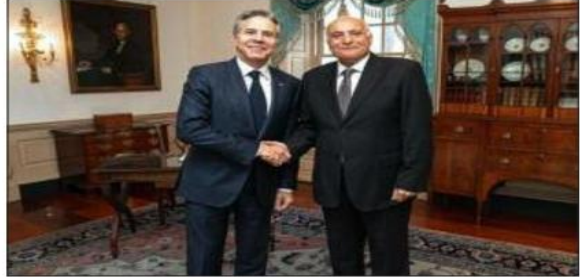
وكتب بيلينكن «التقيت بوزير الشؤون الخارجية الجزائري أحمد عطايف للحديث حول واقع وأفاق الشراكة الأمريكية - الجزائرية ومناقشة العديد من القضايا ذات الاهتمام المشترك، سيما الوضع في

منطقة الساحل». وأضاف السيد بيلينكن «لقد أكدنا خلال محادثتنا دعما القوي للمسار السياسي الذي تتبناه الأمم المتحدة بخصوص قضية الصحراء الغربية». من جانبه، جدد المتحدث باسم وزارة الخارجية الأمريكية ماثيو ميلر التأكيد على «الدعم الكبير الذي يوليه السيد بيلينكن لجهود المبعوث الشخصي للأمين العام للأمم المتحدة، السيد ستيفان دي ميستورا، في محادثاته مع الأطراف المعنية الرامية لإيجاد حل سياسي للصحراء الغربية». كما هنا السيد بيلينكن نظره السيد عطايف - يضيف السيد ميلر - بمناسبة انتخاب الجزائر عضو غير دائم في مجلس الأمن الدولي، مبديا «رغبة الولايات المتحدة للعمل مع الجزائر بشكل وثيق بخصوص كل القضايا التي يعالجها مجلس الأمن الدولي». وفق المتحدث باسم الخارجية الأمريكية.