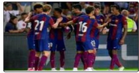
بات نادي برشلونة قريباً من حل لشكلته الرئيسية في فترة الانتقالات الصيفية الحالية، إذ واجه عقبات كثيرة منعت تسجيل لاعبيه الجدد، وصعبت من مهمة ضم نجوم لظلمة حملت بهم الجماهير والدرب تشافي هرنانديز. وأكدت

صحيفة «سبورت» الإسبانية، الخميس، أن برشلونة أمس قريباً من تسجيل صفقاته الجديدة بعد توصل مجلس الإدارة إلى اتفاق مع مؤسسة استثمارية ألمانية تدعى «ليبرو فينسانس» لشراء نسبة 16٪ من أسوديوهات برشلونة من مالكها خايمي ووريس. ويحاول نادي برشلونة الخروج من مشاكله المالية عبر بيع جزء من حقوقه، على أن تبلغ قيمتها 60 مليون يورو، وهذه القسيمة التي تشترطها رابطة كرة القدم الإسبانية على الفريق. فتكون على شكل دخل يحققه النادي عبر عمليات استثمار قانونية ولن يقدر برشلونة في الوقت الحالي على تسجيل الصفقات أو شراء لاعبين جدد، ولا حتى رويو.