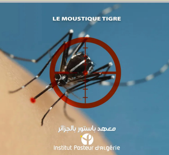
LE MOUSTIQUE TIGRE