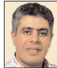
بقلم: عماد الدين حسين

اليوم لا أتحدث عن القواعد الأساسية والمهنية للصحافة والإعلام، كما لا أناقش هل السوشياي ميديا وسائل إعلام، أم لا تزال وسائل تواصل اجتماعي؟